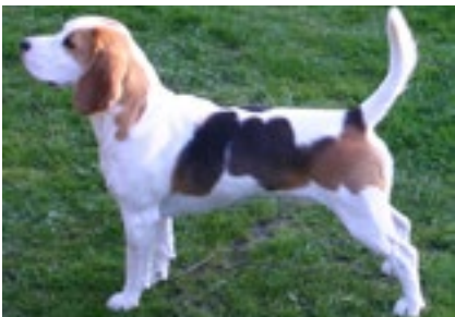
DKCH Skansehøj's Wendy – født i 2007

Er man ny, bør man sparre med en af de erfarne opdrættere, en som man stoler på. Pas på med at spørge for mange, da dette kan resultere i, at man bliver mere forvir-