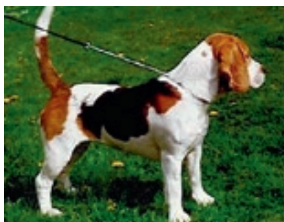
DKCH Skansehøj's Valonia – født i 1988

Hertil kommer at både Wilma og Wendy har været guldtæver i henholdsvis 2004 og 2009. På opdrætssiden er det blevet til mange år med metal, både sølvopdræt og bronzeop-