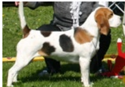
DKCH Skansehøj's Fantasy Devil – født i 2010

Når du skal vælge avlspartner til din tæve, hvad er så vigtigst for dig - type eller udstillingsresultater – når vi forudsætter at temperament og sundhed er i orden?