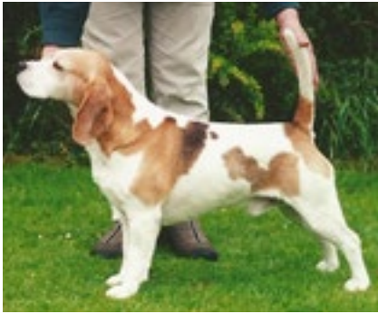
GBCH DKCH Dufosee Capability – født i 1993