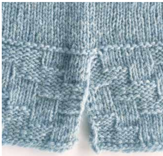
Slids og samling af kanter med overlap.

Strik 14 omg kantmønster K-4 , og luk løst af i rib. Buk kanten halvt indad og kast den til.