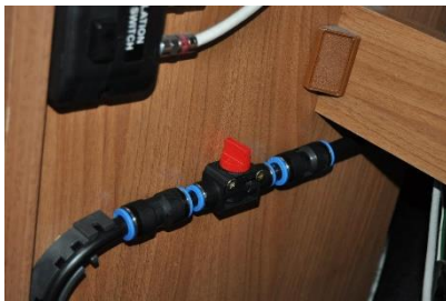
Nu er det muligt at blokere koldt vand til Alde kedlen. Hanen er her lukket.