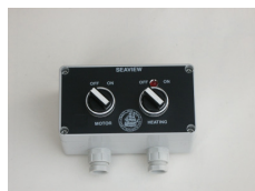
Betjeningsboks for Seaview