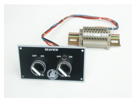
Betjeningspanel for Seaview.