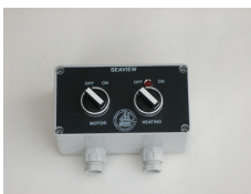
Betjeningsboks for Seaview