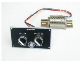
Betjeningspanel for Seaview.