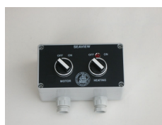
Betjeningsboks for Seaview