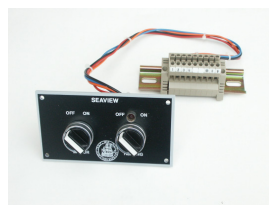
Betjeningspanel for Seaview.